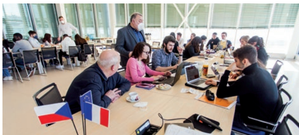
Studenti a pedagogové Masarykova ústavu a Université de Lille zahajují práci na společném meziuniverzitním kurzu „International Project Workshop“; rektorát ČVUT, únor 2022.

Pro budoucnost Ústavu má mimořádný význam rozvoj mezinárodní spolupráce. V průběhu roku 2021 byly obnoveny či nově uzavřeny dohody v programu Erasmus s 28 univerzitami, přičemž mezi novými partnery figurují francouzské, portugalské, irské či italské univerzity (Universidade de Coimbra, Università degli studi di Trento, Maynooth University, Université de Lille či Fondation La Mache). Během téže doby byla uzavřena nová memoranda o spolupráci a dohody o vzájemné výměně i se čtyřmi neevropskými univerzitami, konkrétně moskevskou RANEPa, tchajwanskými Providence University a National Chi Nan University nebo A. N. Beketov Kharkov National University of Urban Economy na Ukrajině. Studenti MÚVS se účastní výměnných pobytů v rámci programu Erasmus, konkrétně v epidemicky nepříznivém roce 2020/2021 celkem 13 výjezdů, např. na Universität Augsburg, TalTech University v Tallinn či nizozemskou Delft University of Technology. 163