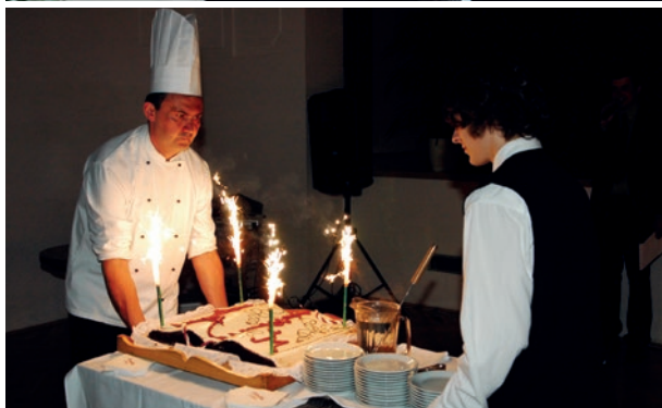
Účastníci večírku měli možnostokusitokusit i speciální MBA & HRM dort ve tvaru knihy.