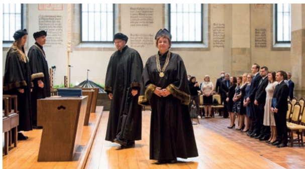
Z promoce absolventů Masarykova ústavu, říjen 2021

z větších domácích firem. V rámci dvouletého navazujícího magisterského programu bude posílena tematika inovací a projektového řízení. 153