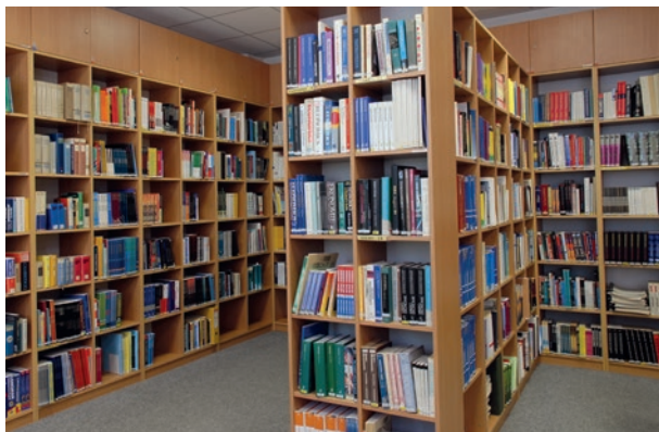
Budování knihovny věnoval Ústav značnou péči. Pohled do prostor knihovny v budově v Horské ulici, listopad 2007.