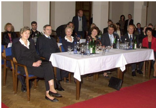
Vedení Ústavu a hosté na akci Ústavu, patrně Klubu MBA, listopad 2004.