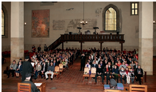
Absolventi a další účastníci promoce absolventů MÚVS, listopad 2012.

V letech 2010–2011 dosáhl zájem o studium pedagogiky svého vrcholu, po němž zájem o učitelství odborných předmětů do určité míry slábl, zřejmě v souvislosti s programo-