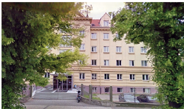
Jako nové sídlo Ústavu byla určena tzv. Nová budova tzv. Masarykovy koleje v pražských Dejvicích, pohled z června 2010.

Stěhování do budovy v Dejvicích nutně předcházela vcelku rozsáhlá rekonstrukce zmíněné části Masarykovy koleje (tzv. etapa A sever), zejména v případě prostor pro výuku. (Budova byla původně koncipována jako kancelářská, a proto muselo dojít ke spo-