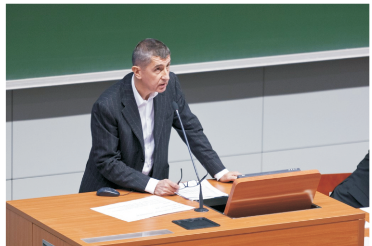
Přednáška A. Babiše Český inženýr - ohrožený druh 20.11. 2012