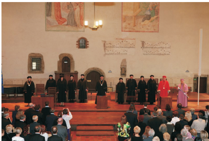
Promoce MÚVS 15.11. 2012 v Betlémské kapli