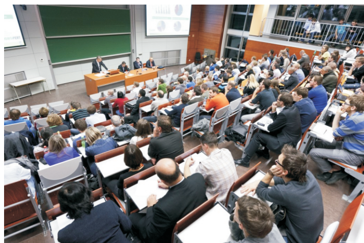
Přednáška A. Babiše Český inženýr - ohrožený druh 20.11. 2012

S některými pravidly zaváděnými Evropskou unií Andrej Babiš nesouhlasí, nicméně v obsazení žen do vedoucích pozic nevidí žádný problém. Spolupráci s některými ženami-manažerkami si naopak velmi chválí.